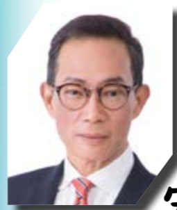
香港個人資料私隱專員黃繼兒