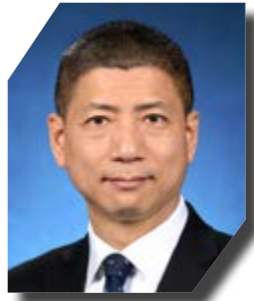
知識產權署署長黃福來