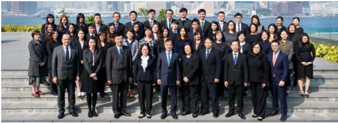
Moores Rowland (HK) CPA Limited 致意