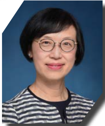
互聯網專業協會二十周年誌慶