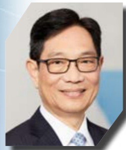
香港應用科技研究院董事局主席王明鑫