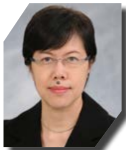
創新科技署署長蔡淑嫻