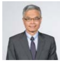
香港科技大學校長史維 敬賀