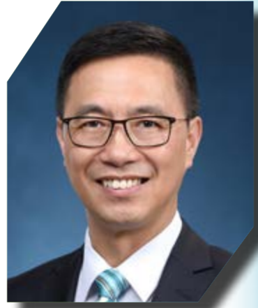
互聯網專業協會二十周年誌慶