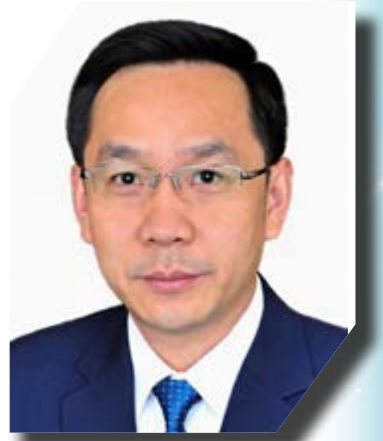
互聯網專業協會二十周年誌慶