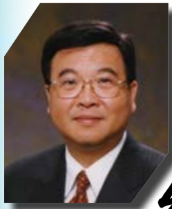
香港公開大學校長