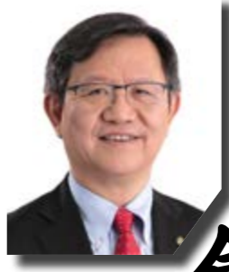
香港生產力促進局主席林宣武