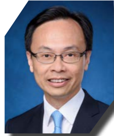
互聯網專業協會二十周年誌慶