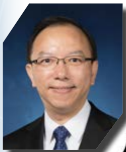
政府資訊科技總監林偉喬